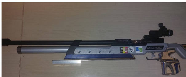
Figuur 3 Dit is NIET toegelaten