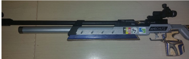
Figuur 1 Dat is toegelaten

De Wig mag niet voorbij het voorhout van het wapen komen