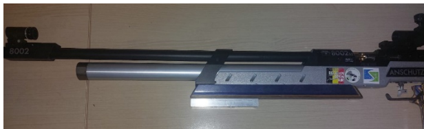
Figuur 2 Dat is toegelaten